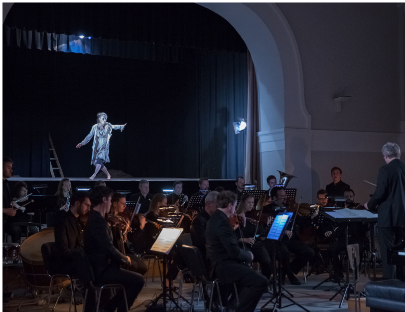
Adagio in memoriam B. Britten op. 62a – während der Aufführung (mit Choreografie) / during the performance (with choreography)

prominent works of absolute music, but also as a conductor, chamber musician and song accompanist.“